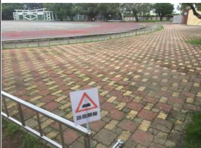
樹根竄起地面不平