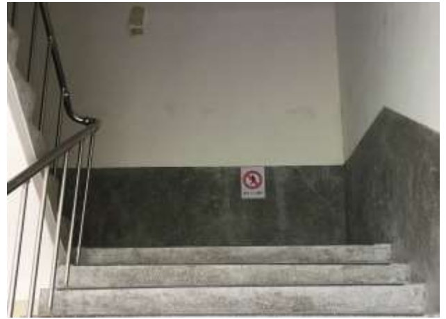
校內交通標誌設置，結合情境教學：頂樓不得進入