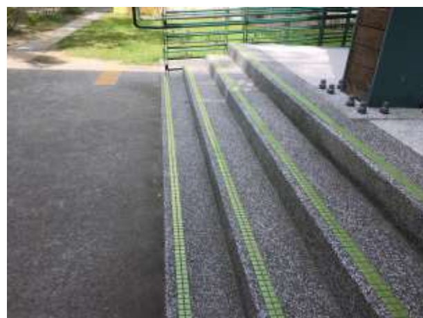
利用色塊拼貼設計，上下階梯明顯