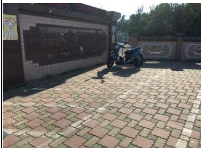
設置家長接送區機車停車格