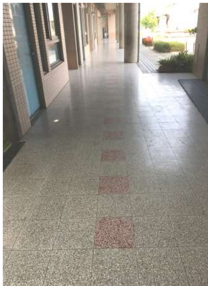
校內交通標線設計，左右分向分隔線，進行情境教學