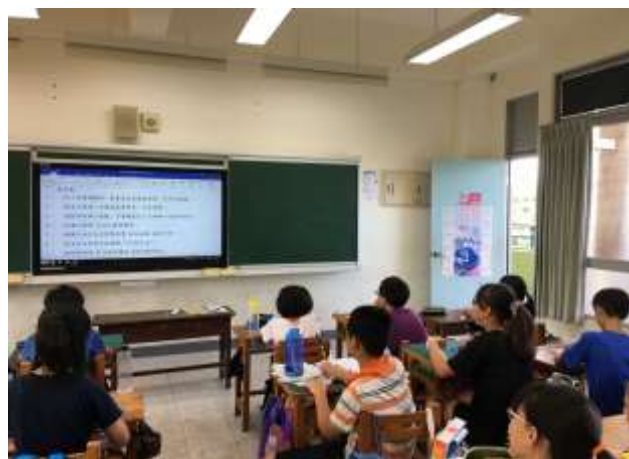
實施交通安全常識測驗