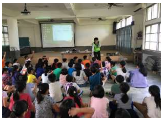
講師宣導情形與學生的互動