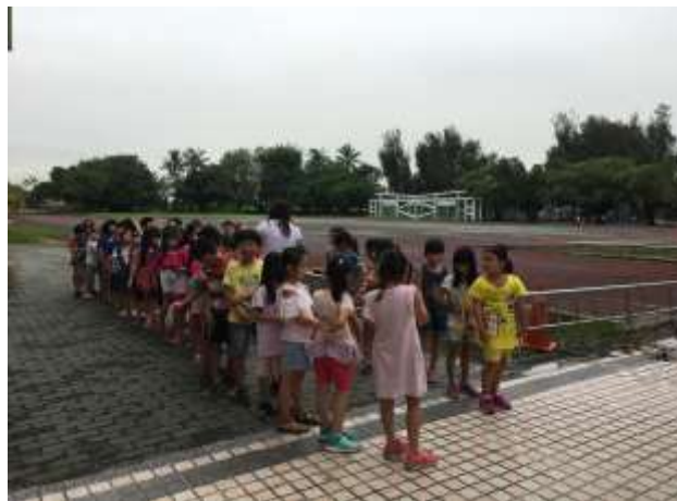
新生進行路隊整編及訓練