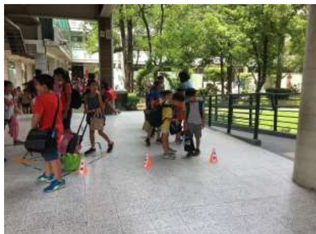
期初全校路隊整編，放學時於指定位置集合