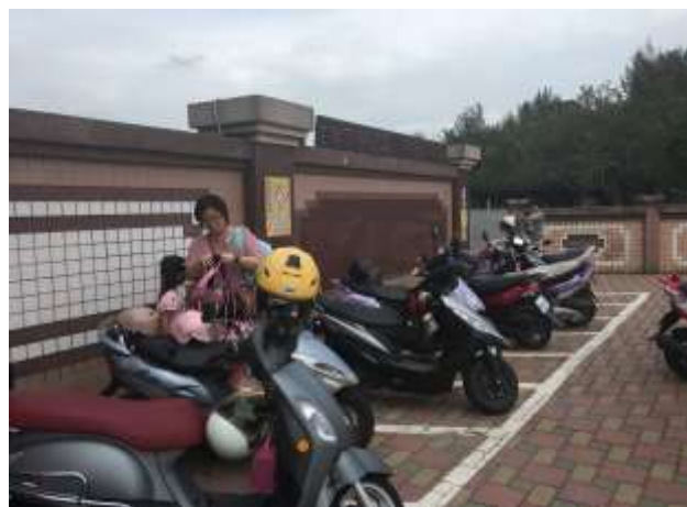
機車接送區家長車輛排放整齊