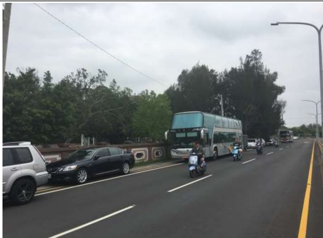
汽車接送區家長車輛排放整齊